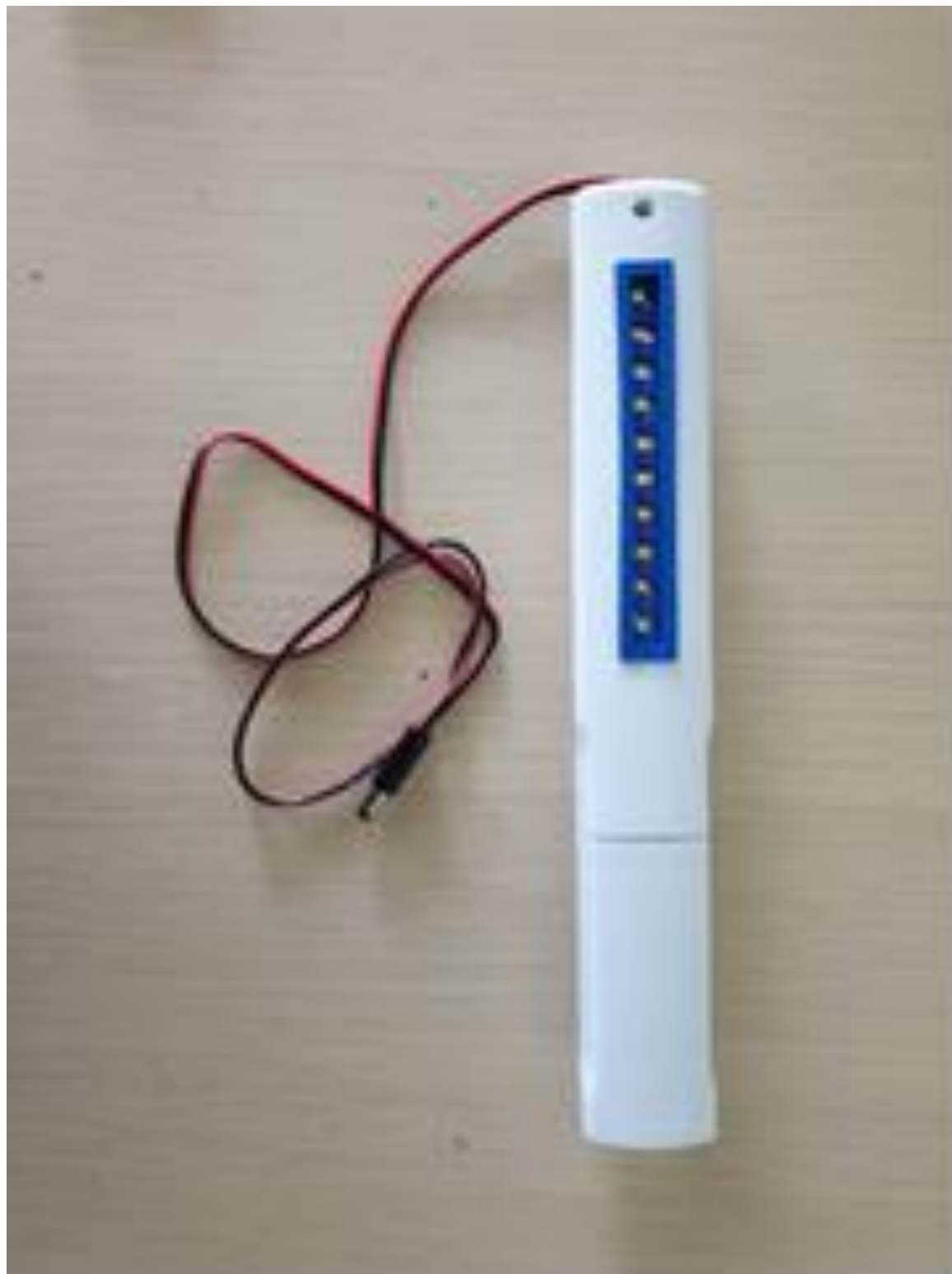
Dispozitivul de dezinfectare a echipamentului și instrumentelor medicale