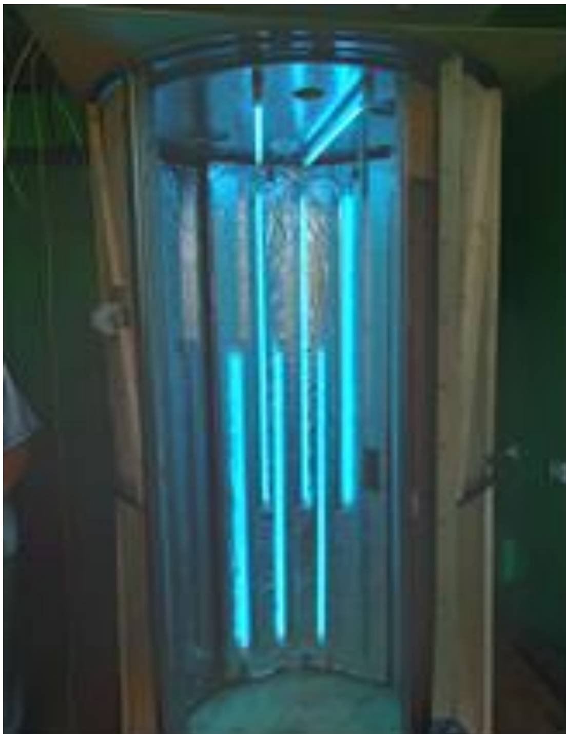
Boxa destinată dezinfectării vestimentației